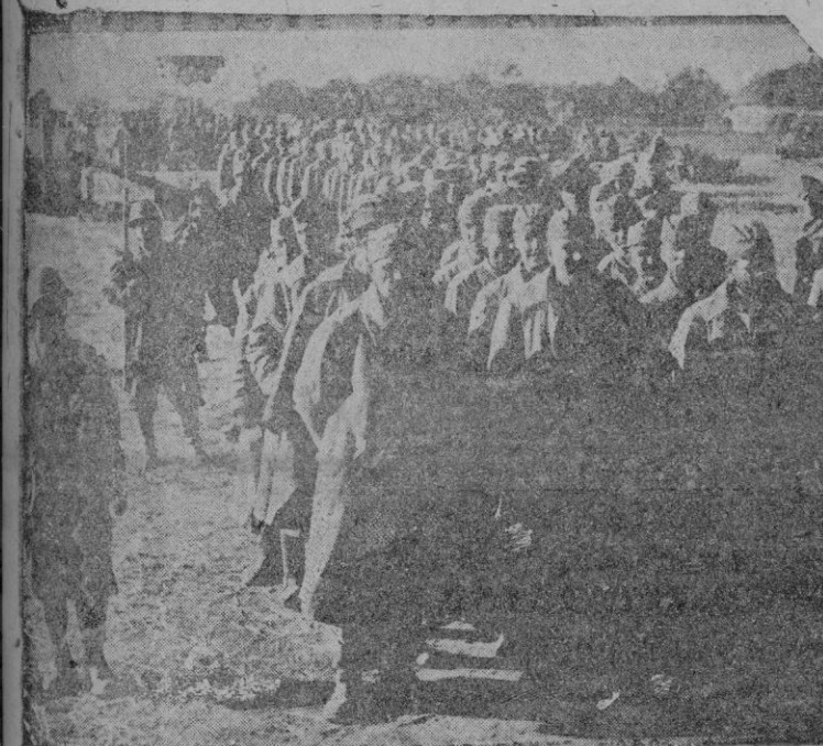
Largas, interminables columnas de prisioneros rusos

En Sóller los torcos se venden a 0'75 la pieza y las setas se cotizan de 2'50 a 3'00 ptas la libra.