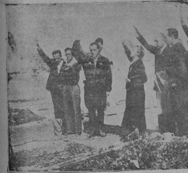
Ante la tumba de José Antonio en el cementerio de Alicante