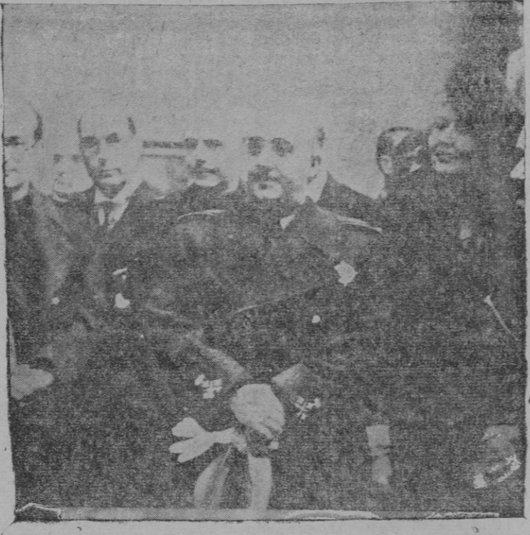
El Caudillo en la inauguración de la Exposición Nacional de Bellas Artes

La nota publicada ayer, de la Federación Diocesana de Congregaciones Marianas Masculinas de Mallorca, señala los actos en que ha de consistir la celebración del "Día del Obispo" que ha de celebrarse mañana domingo.