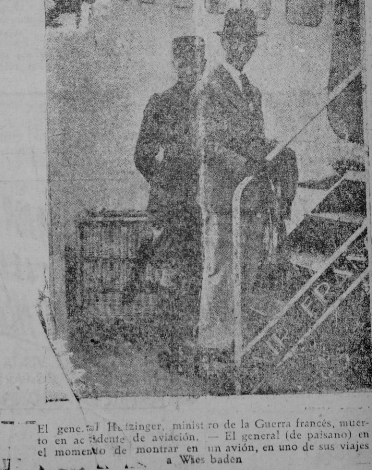
El general Heizinger, ministro de la Guerra francés, muerto en accidente de aviación. El general (de paisano) en el momento de montar en un avión, en uno de sus viajes a Wiesbaden

El Ayuntamiento aprobó por aclamación el presupuesto ordinario para 1942 que asciende a 8.660.690,62 pesetas, de las cuales 5.000 pesetas corresponden al aguinaldo de la División Azul.