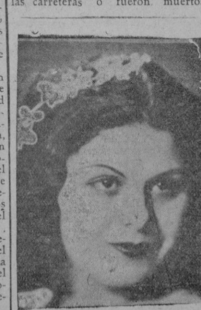
Fernanda Basile, la eminente diva, que tan señalado triunfo ha obtenido cantando en el Lírico

lucha de clases criminal. Este es el verdadero rostro de Stalin, que no vacila en convertir niños desamparados en objeto de su odio y de su venganza. Por fin ha llegado el día en el que ha surgido un vengador de estas hazañas."