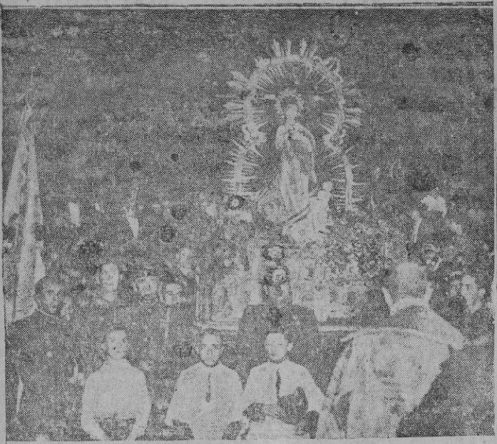
El traslado de la Virgen al Alcázar de Toledo, el día del aniversario de la liberación del Alcázar

Llenas están las crónicas de los primeros siglos del Cristianismo de leyendas poéticas que revelan como la nueva religión vino a estrechar los vínculos de amor entre la naturaleza y el hombre. Mas ni la leyenda cristiana, ni la pagana fabulosa mentan a nadie que de tal suerte amase la naturaleza y la atrajese como Francisco de Asís. Se le llama el Orfeo de la Edad Media, y cierto que de él pudo decirse lo que de Orfeo cantó Simónides: —"Innumerables pájaros revoloteaban sobre su cabeza, y, enderezándose, saltaban los peces fuera de las sombrias olas por oír su dulce cánti-