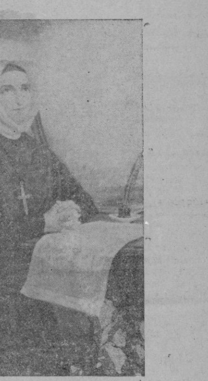
La nueva Beata nació en Grenoble el día 29 de agosto de 1769, ingresando en el Instituto fundado por Santa Magdalena Sofía Bar

Día 22. - Fiesta de Santa Rita de Casia, Abogada de imposibles, Protectora contra toda enfermedad contagiosa y Patrona de los Talleres de Caridad.