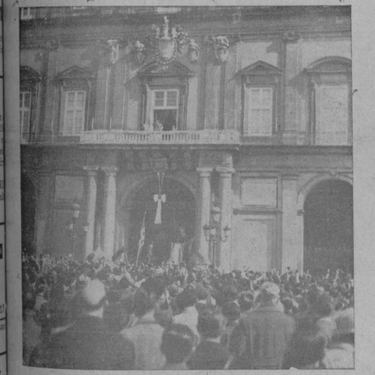
El Príncipe de Piemonte recibiendo en el balcón de su palacio de Nápoles, las muestras de simpatía de la población con motivo del nacimiento de la Princesa María Gabriela