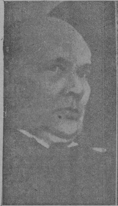
Sillampaa, ilustre novelista finlandés, a quien se ha concedido el premio Nobel de Literatura 1939

El Jefe Provincial de Propaganda. Saludo a Franco: ¡Arriba España!