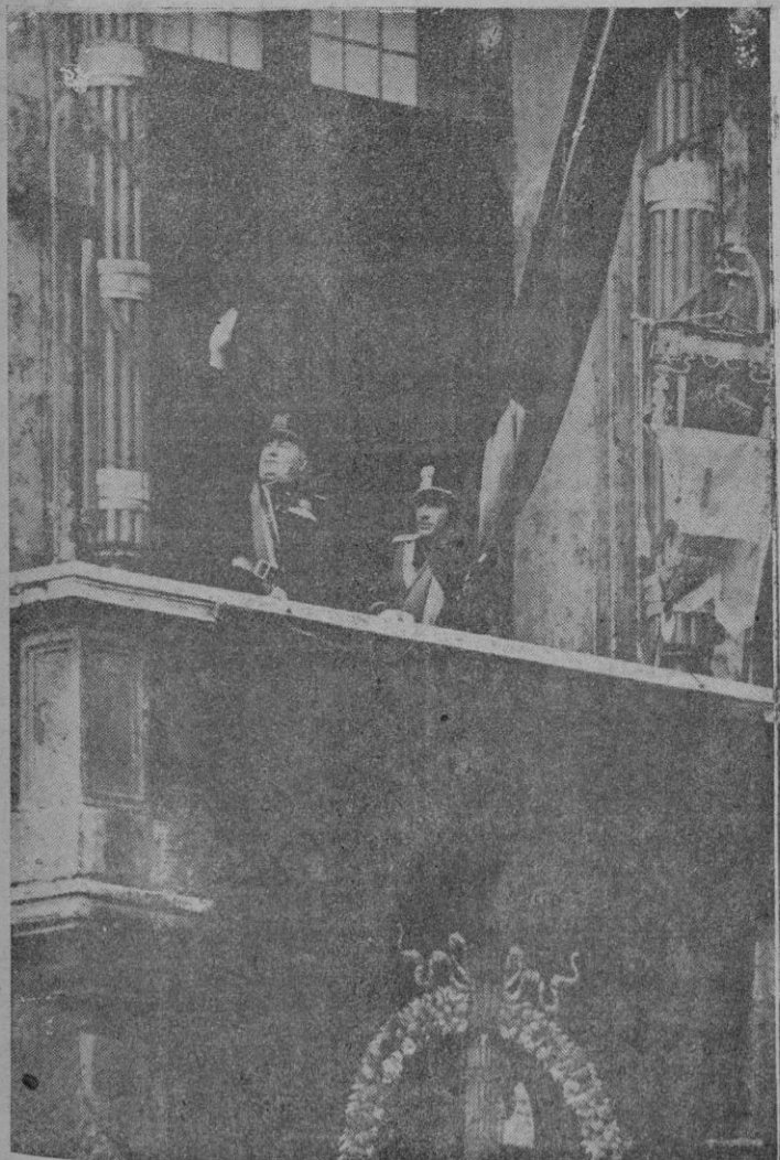
Musolini, en el balcón del Palacio de Venecia, saludando a la muchedumbre que le ovacionaba con motivo del XVIII aniversario de la marcha sobre Roma

El SEGURO PATRONAL de MUTUA BALEAR te ofrece los medios.