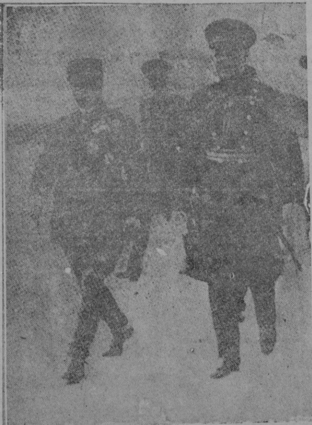
Los jefes supremos de los Ejércitos francés e inglés, generales Gamelin y Vizconde Lord Gort

Bruselas.—En los círculos bien informados, se asegura que hoy será entregada la contestación del Gobierno belga a la nota británica recibida la semana pasada, en la cual el Gobierno in-