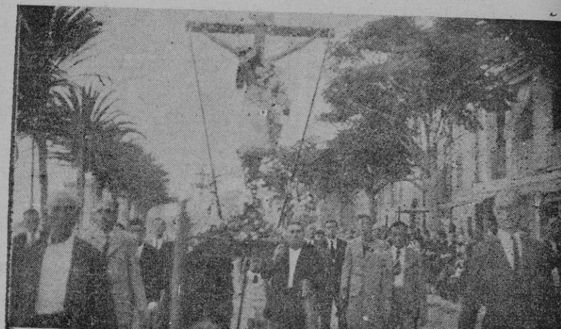
La procesión de la Preciosísima Sangre de la Iglesia del Molinar

se empezó a organizar la procesión, a la que pueda decirse que asistió todo el pueblo, colonia veraniega y mucha gente de Palma, siendo muchos los hombres que querían llevar las imágenes y en especial la de la Preciosa Sangre.