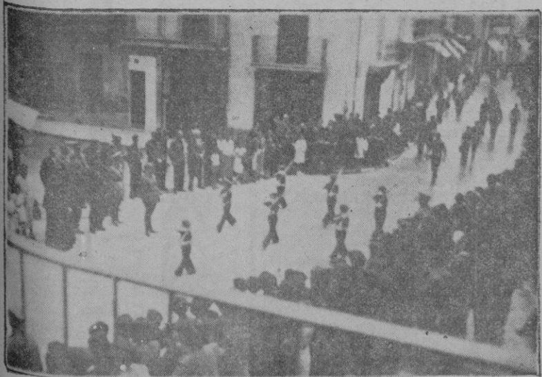
Las O. J. de Inca, en la fiesta de San Fernando, desfilando ante el Comandante Militar de aquella plaza