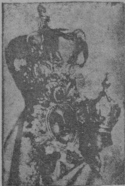
La Virgen de la Cabeza