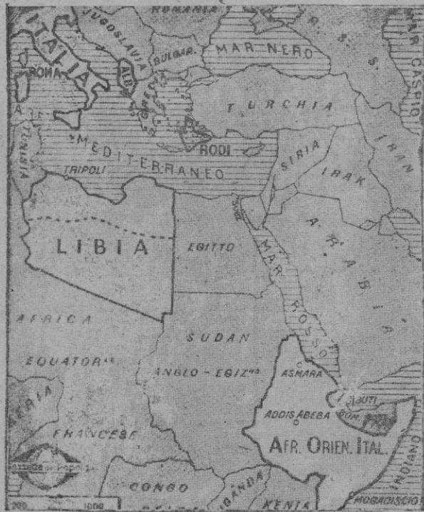
Nuevo mapa del Imperio italiano: todos los territorios en blanco pertenecen a Italia: la península, las islas de Cerdeña, Sicilia y Rodas, Libia, Africa Oriental italiana y Albania