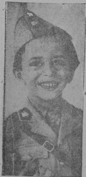
El nuevo rey del Irak. — Se llama Feisal, es hijo de Ghazi, que murió en accidente de automóvil, y cuenta cuatro años de edad

ta y dos vientos de la rosa náutica para expandir la ocupación de la Villa y Corte, en alas de un alceya inmenso y multitudinario? Ya ensancha nuestros espíritus y eleva nuestra respiración a presiones de difícil acceso ese sostenido rugido metálico que tantas veces martilleó nuestro cerebro y orientó nuestro instinto en la noche de la alarma sin vereda y sin luz; desplomábanse tabiques y columnas de sacos terreros que obturaban pórticos, claraboyas y tragaluces. Ciudad y pueblo surgen a un alivio de gracias y exquisiteces; corren y jue-