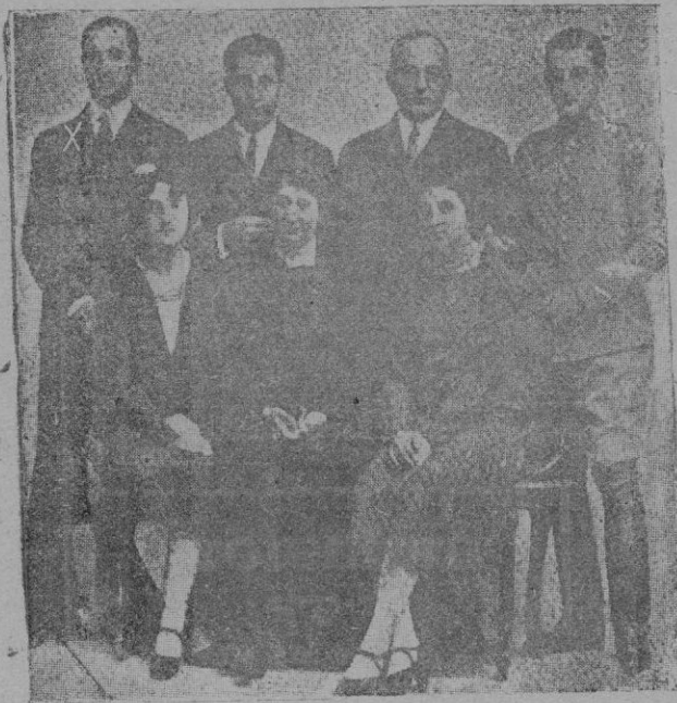
Don Miguel Primo de Rivera, que hoy es esperado en Palma, después de verse libre de la cárcel marxista, fotografiado con su padre el ilustre Marqués de Estella y sus hermanos.

Y pertrechado de ese conocimiento previo, fui a ver la comedia de Bernard Shaw "Ginebra". Todo es allí confuso y caótico, como la Europa que quiere pintar. Sátira y caricatura. La Sociedad de las Naciones, decrepita apenas nacida, nutriéndose de palabras vanas, mientras brota en el mundo una nueva realidad, viva, impetuosa y juvenil. Pero es claro que un autor dramático tan experimentado como Shaw no puede caer en la ingenuidad de desbaratar los torpes