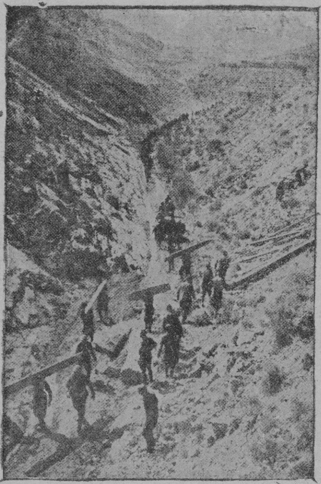
Es tan rápido el avance de nuestras tropas en Cataluña, que los ingenieros han de improvisar rápidamente nuevos caminos para acelerar el envío de los aprovisionamientos, a compás de los grandes avances

Parece pues, que a las quintas movilizadas es necesario recuperarlas por todos los medios posibles; lo que equivale a decir, inequívocamente, que los milicianos ya no se hallan dispuestos a dejarse matar por una causa que juzgan completamente perdida.