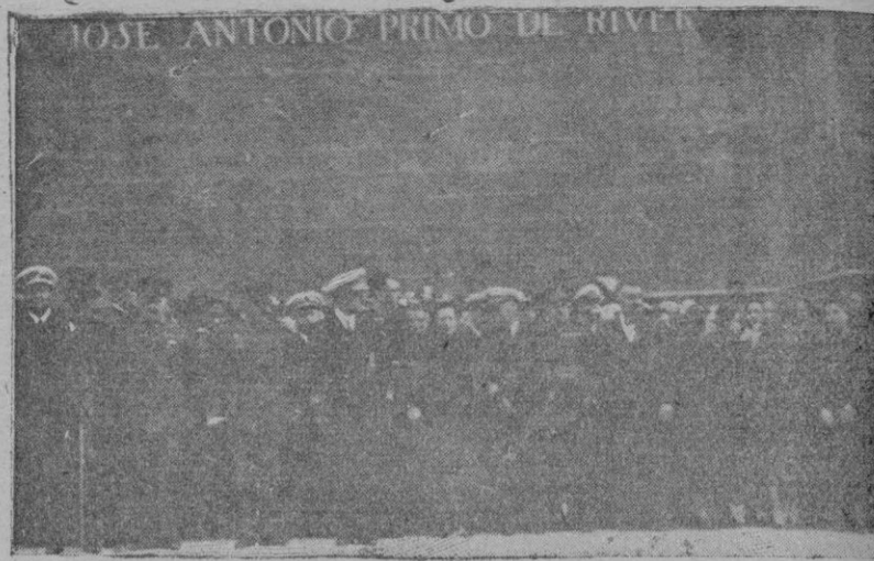
Las Autoridades ante la lápida de José Antonio, en la Catedral, presenciando el desfile de las tropas

Terminados los funerales, se descubrió a presencia de numeroso público la inscripción con el nombre de José Antonio Primo de Rivera, estampado en la parte izquierda de la fachada principal y al pie del mismo pronto fueron colocadas coronas y