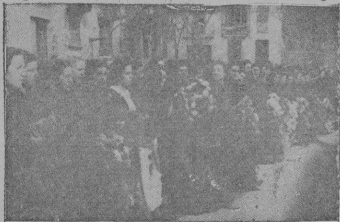
La juventud femenina al ir a depositar las coronas

Toda la tarde transcurrió como día que era: de luto Nacional. El interés estaba pendiente de los discursos que iban a pronunciar el Caudillo y los Ministros, Excmos. Sres. Serrano Suñer y Fernández Cuesta.