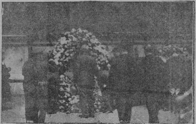
Momento de depositar las coronas del Ejército y de la Marina, en el muro de la Catedral