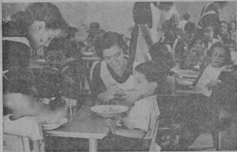
La obra de Auxilio Social. — Las camaradas de Palma, en su bienhechora función de dar de comer a los pequeños, cumpliendo la alta misión impuesta por el Caudillo de que el pan no falte a los desamparados.

y de fondo: a compás que se agrupen de nuevo las familias, que trabaje el padre o la madre, irán desdoblándose los Comedores Infantiles y las Cocinas de Hermandad apagarán su lumbre, según vayan encendiendo las suyas los hogares de España.