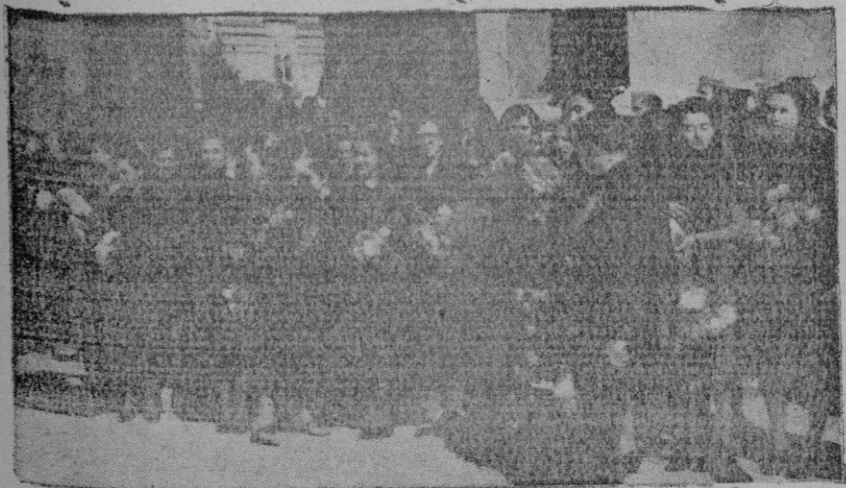
Grupo de señoritas que se dirigía a depositar ramos de flores en la Cruz de los Caídos