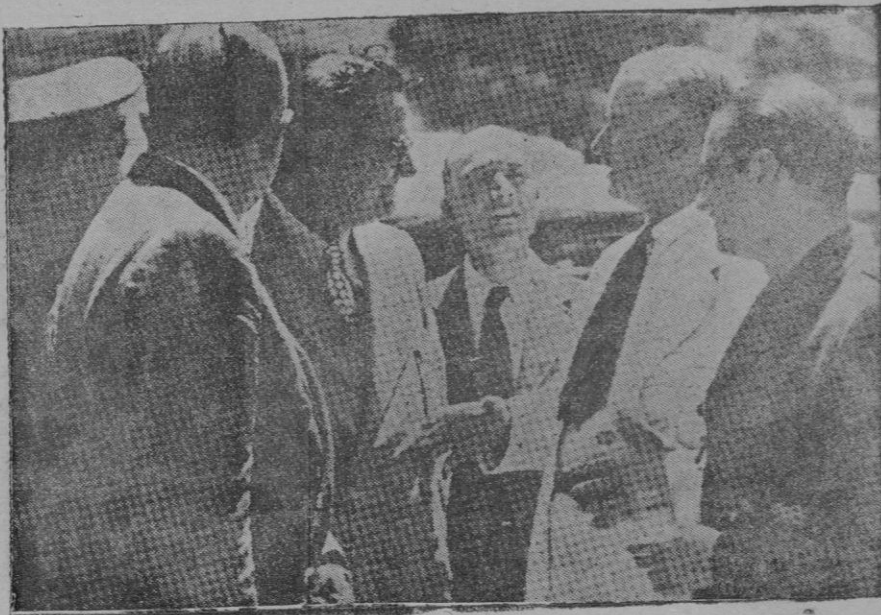
El político francés y gran amigo de España, Doriot, hablando en Sevilla con el general Queipo de Llano

Está visto el fracaso de la no intervención, precisamente por parte de quienes parecían ser sus más preclaros defensores, y han hecho que nuestros enemigos hayan encontrado en ella la fuente para una ayuda escandalosa, pero el triunfo está demasado cerca para que se pueda impe-