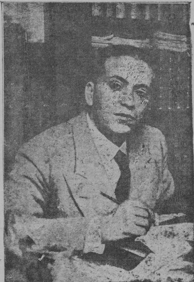
Calvo Sotelo, el ilustre tribuno, mártir de la Patria, a quien hace dos años los esbirros del ministro Casares Quiroga asesinaron a mansalva, crimen que horrorizó a todas las conciencias honradas, y fué el fulminante que hizo estallar el Glorioso Alzamiento Nacional