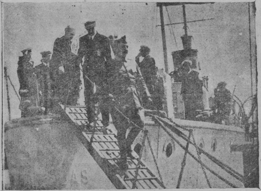
El Generalísimo Franco, acompañado del Almirante Moreno y del Ministro del Interior, bajando del "Canalejas" en la visita que hizo a la flota en Vinaroz