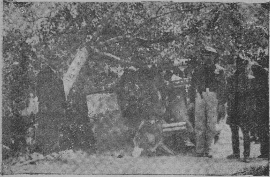
Estado en que quedó el automóvil que en la madrugada de ayer dió contra un árbol en la carretera de Inca, y a consecuencia del choque resultaron un inuerto y cuatro heridos