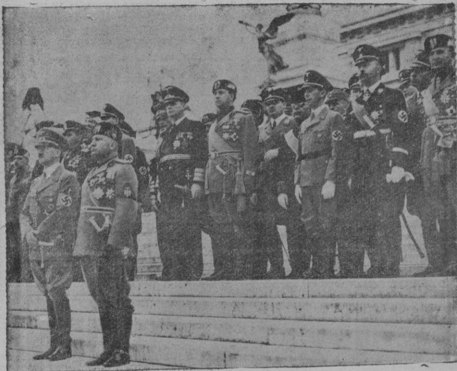
El Führer y el Duce asistiendo en la Plaza de Venecia al canto de los coros imperiales