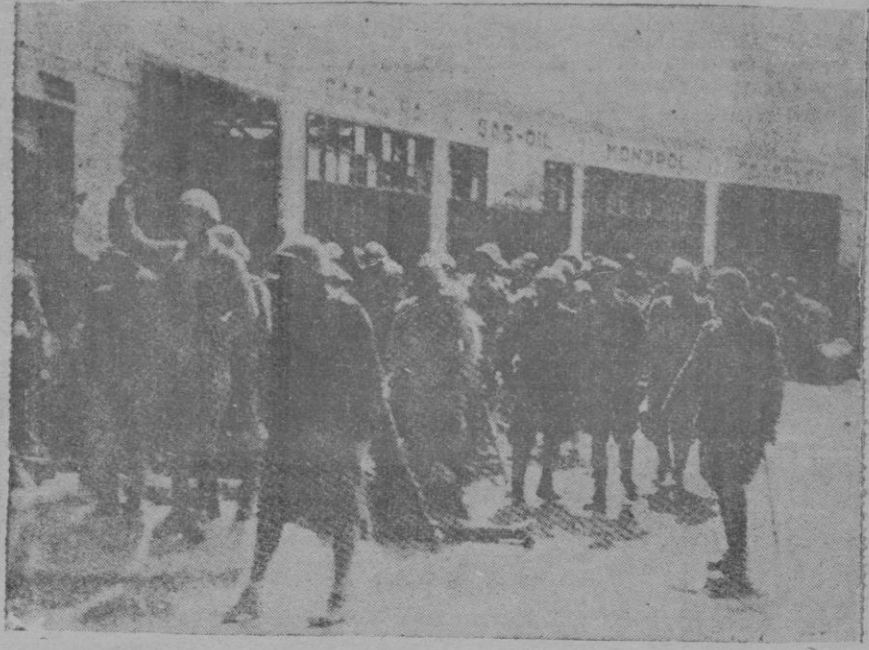
Nuestras tropas tomando posesión de una fábrica y depósito de gasolina de los arrabales de Tortosa