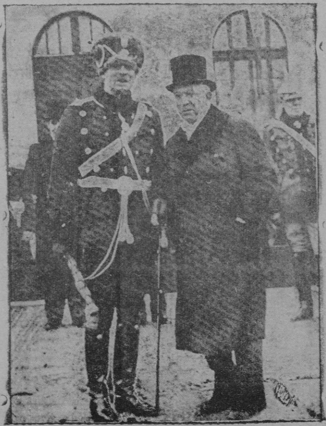
El Rey Carlos de Rumania y el nuevo jefe del Gobierno, Sr. Goga

Su contenido una botellita de coñac, galletas, embutidos, queso, tu-