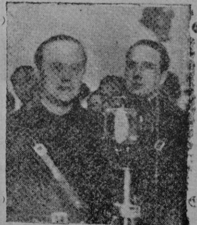
Fernández Cuesta, uno de los más destacados valores de F. E. T. y de las J. O. N. S., ante el micrófono

Lo menos conocido de Mallorca para el resto de los españoles es su potencialidad económica, que se ha puesto de relieve al quedar aislada