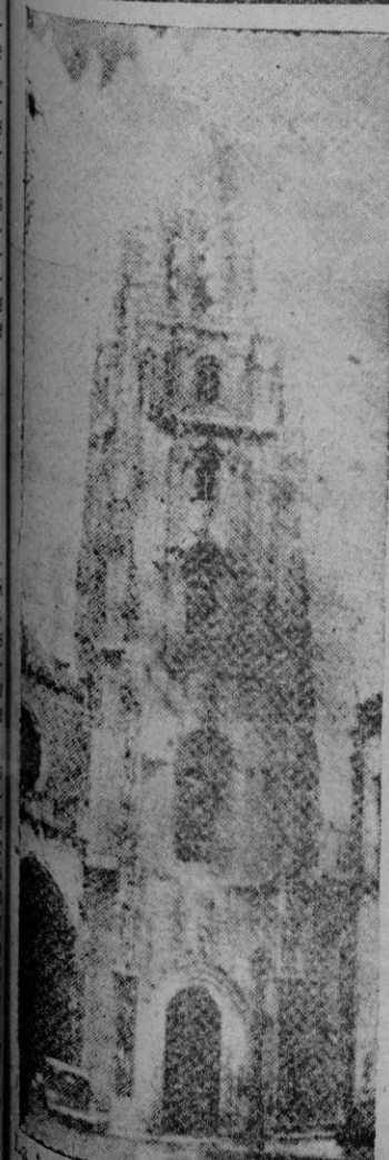
La torre de la Catedral de Oviedo, destruida por el feroz bombardeo en que los rojos descarraron sobre la capital asturiana