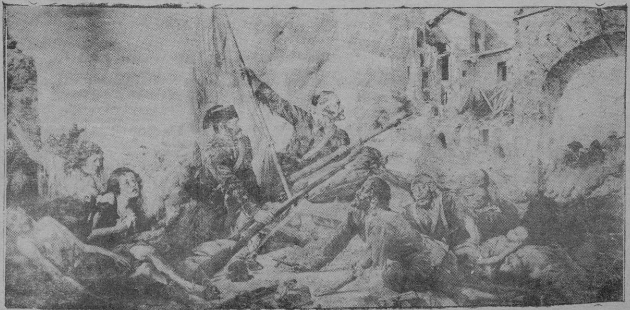
El cuadro de Ochoa. — "Los defensores de Santa María de la Cabeza"

Hay cuerpos que sufren; aquel Guardia Civil moribundo, tendido sobre la dura tierra, no podrá servir de moledo a una nueva piedad; es materia que termina su carrera vital en medio de sufrimientos grandes, lacerada por múltiples heridas, tendida sobre el regazo de la Madre