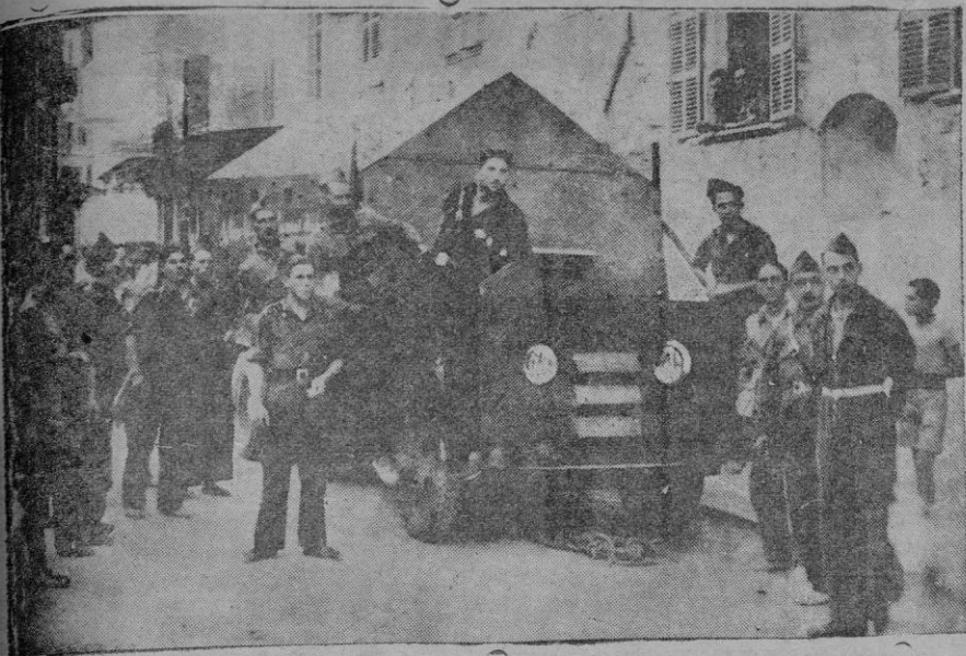
Camión blindado que nuestras fuerzas cogieron al invasor