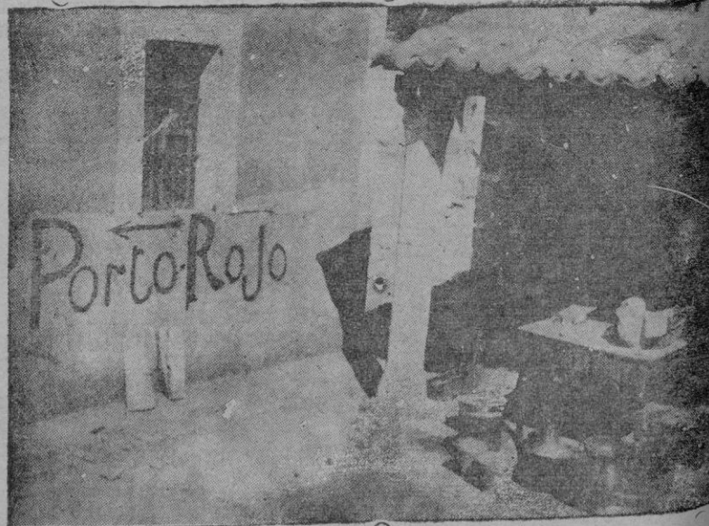
Los instintos satánicos de los expedicionarios. Se dedicaron a cambiar el nombre; ya para ellos no era Porto-Cristo, sino Porto-Rojo