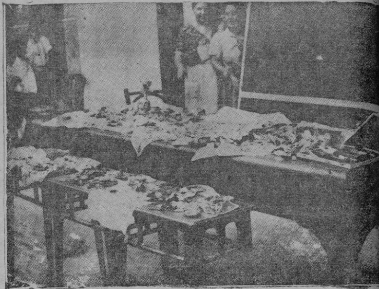
Mesa expuesta en Manacor, con el oro que fué encontrado en los bolsillos de los prisioneros rojos. —¡No perdían el tiempo!