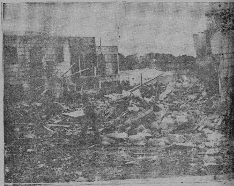
Casas derribadas; montones de escombros, esto era una calle de Porto-Cristo