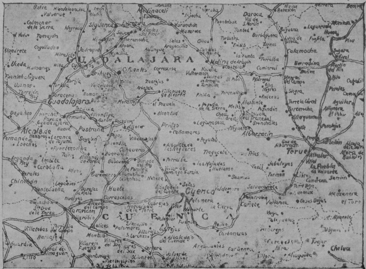
Mapa de la región de Teruel, con las provincias de Cuenca, Guadalajara y parte de la de Madrid

El comunismo utópico debía basarse en una completa libertad para moverse en la comunidad con cariño fraternal y recíproco, pero en Rusia no existe ni reminiscencia de liber-