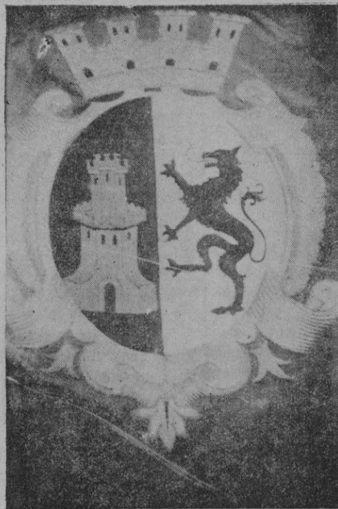
La bandera de combate del crucero "Baleares" que regala la sección femenina de la F. E. T. y de las J. O. N. S.