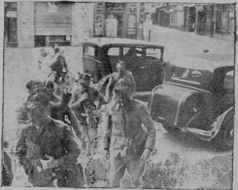
La patrulla del antigás, con su traje de protección, simulando un servicio en la Plaza de Cort