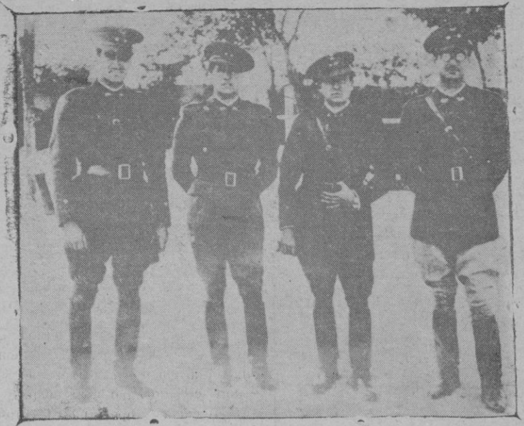
El equipo militar que en representación de España ha de tomar parte en los concursos hípicas de la Olimpiada de Berlín

De la inspección ocular se ha podido comprobar que el ladrón había penetrado por una ventana que existe en la planta baja de la fachada que da al