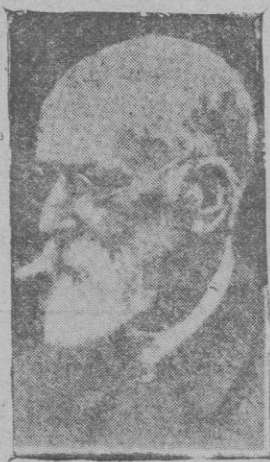
D. José Benlliure, que acaba de fallecer

En D. José Benlliure concurría la circunstancia de ser uno de los sucesores directos de una familia de artistas que ha constituido una dinastía gloriosa. El octogenario pintor, que pertenecía a familia modesta, demostró su precocidad desde su más tierna infancia, recibiendo lecciones, en sus balbuceos pictóricos, de su padre, notable pintor decorador; después lo acogió bajo su tutela otro gran maestro, D. Francisco Domingo, preparando al joven Benlliure, que ya ayudaba a su familia con el producto de su labor artística, otorgándole la Diputación valenciana la primera distinción al enviarle, cumplido los catorce años, pensionado a París, donde se puso en contacto con los grandes maestros de aquella época, hasta que se instaló en Italia, residiendo durante treinta años en Asís, mientras sus compañeros Pradilla, Fortuñy, y Vi-