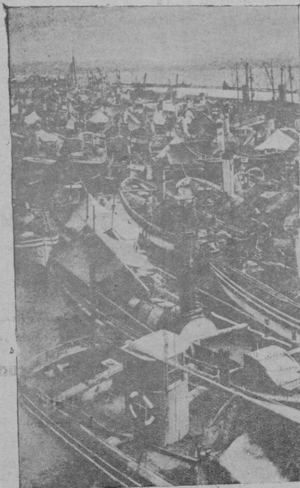
La galerna del Cantábrico. — Los vaporcitos de pesca en el puerto de Santander, algunos de los cuales fué víctima de la galerna