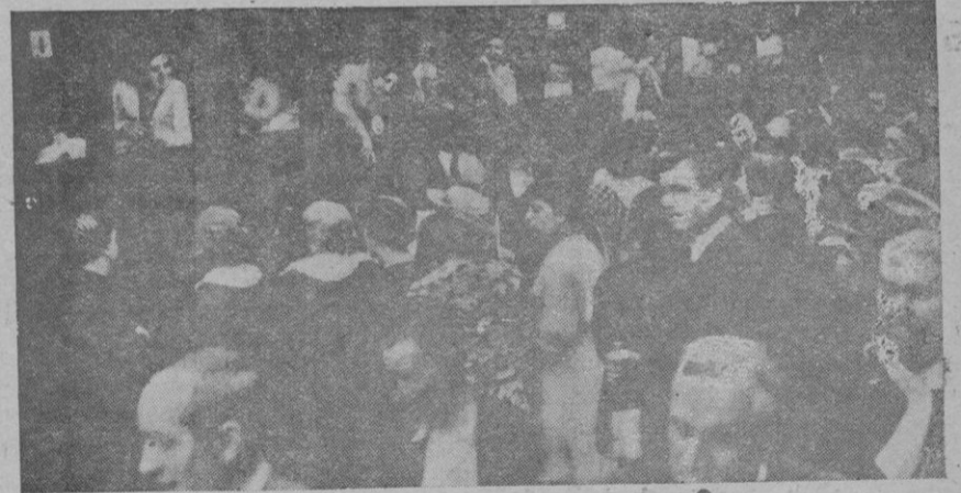
Salida de Barcelona de la peregrinación catalano-mallorquina para Lourdes

Además pueden decir que ayer, por unos despidos, por motivo justificado, los obreros de la fábrica Cros de Por-