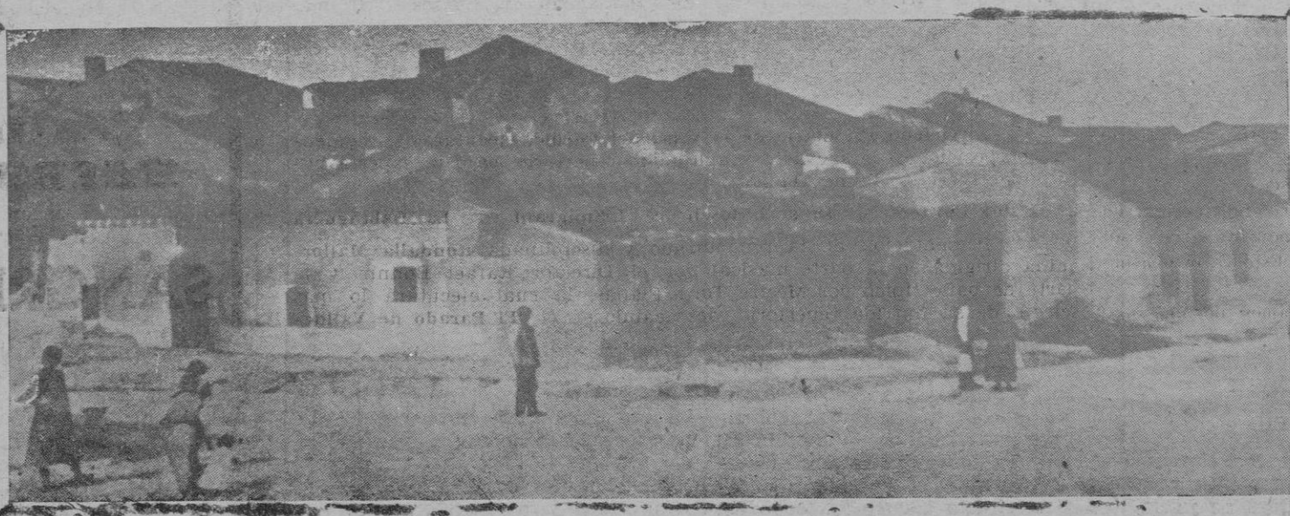
Barriada de casas que eha quedado destruída por el incendio del domingo en Horcajo de las Torres