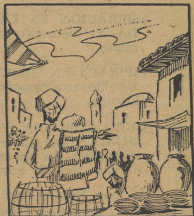
Veterano jugador «merengue»