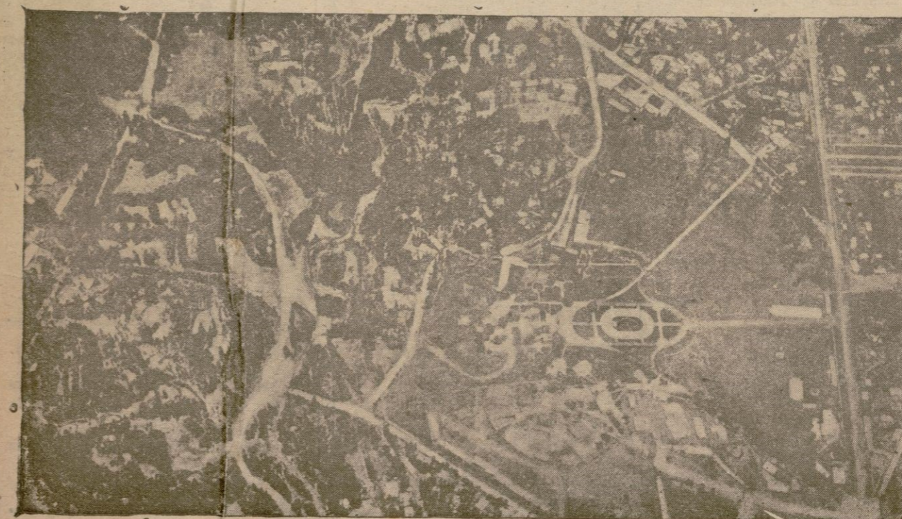
Una vista del Palacio imperial de Addis Abeba y de sus alrededores tomada por un avión italiano

Al visitar ayer mañana los periodistas, al señor Gobernador, nos manifestó que había autorizado la manifestación que debe celebrarse esta mañana. Nos añadió, también, que se tomarán las debidas medidas, a fin de que los servicios públicos estén completamente garantizados.