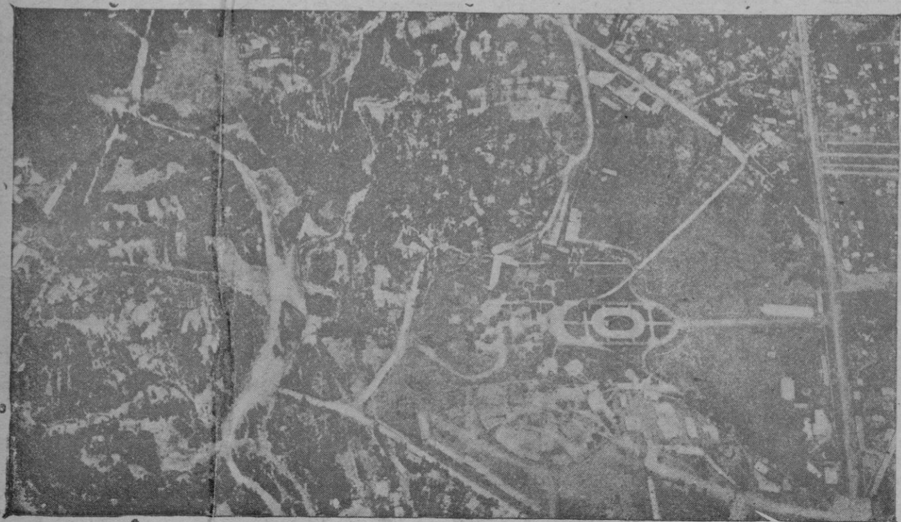
Una vista del Palacio imperial de Addis Abeba y de sus alrededores tomada por un avión italiano

Nos añadió, también, que se tomarán las debidas medidas, a fin de que los servicios públicos estén completamente garantizados.