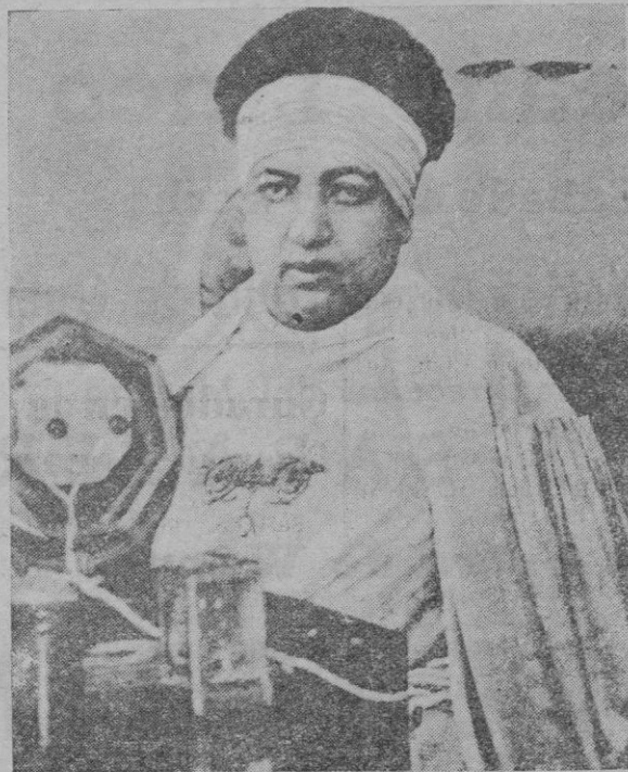
Addis Abeba. — La emperatriz de Abisinia dirigiendo un llamamiento al mundo por medio de la radio