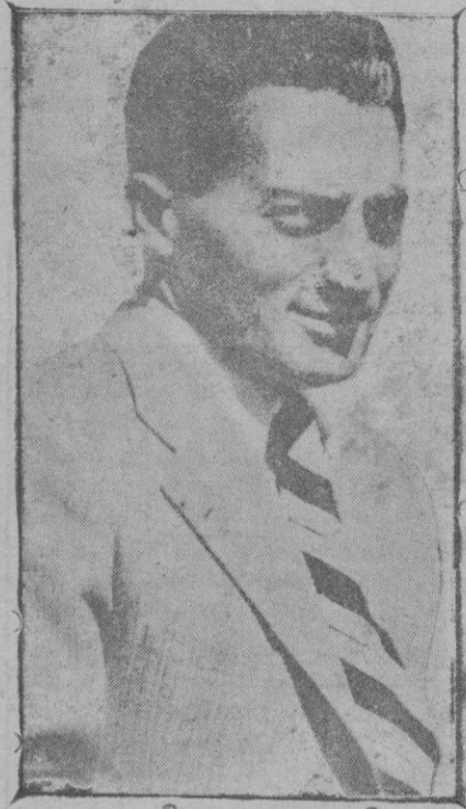
El ex jefe de orden público de Catlauña D. Miguel Badia, que ha sido asesinado junto con su hermano, en Barcelona