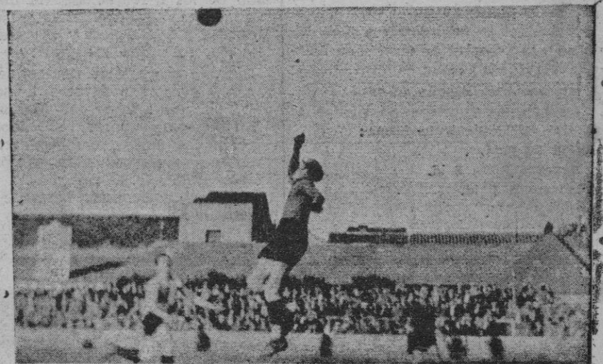
Estabens rechaza un tiro de Calvet del Sabadell, durante el partido de Copa España que venció el Sabadell por 4 a 1

rándoles de corazón el más lisonjero éxito en la empresa que van a acometer, seguros de interpretar de este modo el unánime sentir de todos vosotros, aficionados mallorquines, que leéis estas líneas.