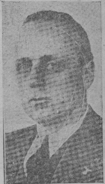
Von Ribbentrop, embajador extraordinario del Reich, que ha asistido a la conferencia de Londres

Suben al Puig de San Salvador, hermoso otero que domina una vasta llanura sembrada de cenicientos y tranquilos olivares. En su cumbre, como una acrópolis humilde, hay el cinto de una muralla antigua. La iglesia es chica y bella. En la plazoleta se puja al más beneficioso postor, el subido honor del primer baile ("la primera mateixa") que habrá de bai-