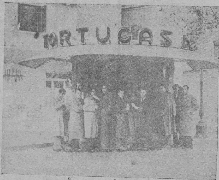
Jugadores del Oviedo F. C. tomando el aperitivo en Tortugas Bar (el de los deportistas)