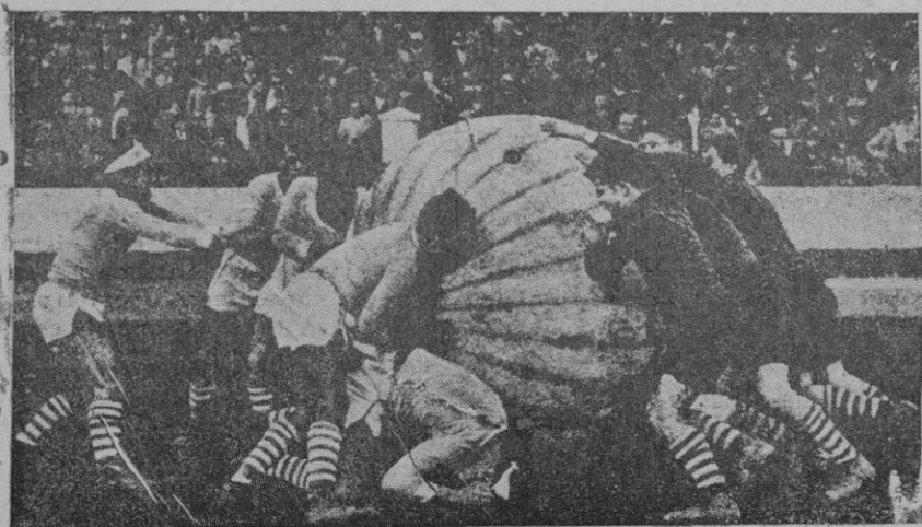
Exhibición de "push-ball", nueva modalidad del juego de pelota, que llamó poderosamente la atención de los espectadores