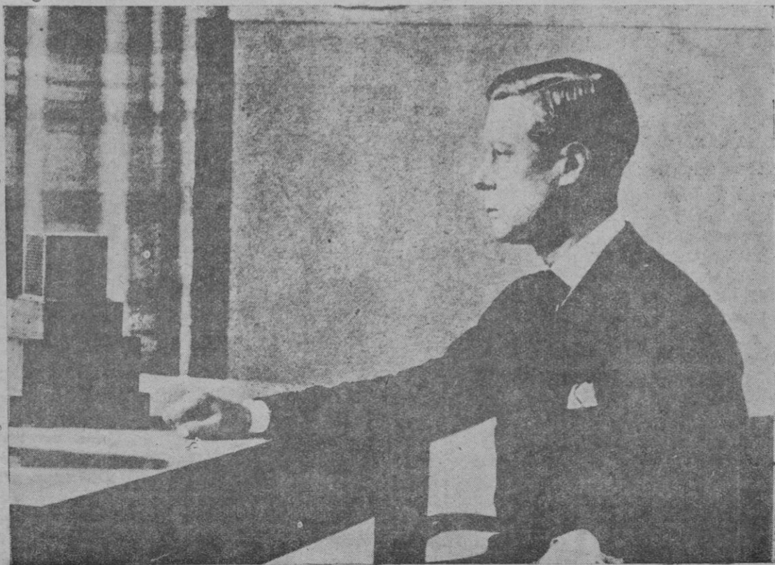
El rey Eduardo VIII, dirigiéndose por radio a todos los pueblos del Imperio británico

Por la presente se convoca a los Maestros del Plan de 1914 a la reunión que tendrá lugar el próximo domingo día 8, en el Museo Pedagógico a las diez y media de la mañana. Se ruega la asistencia y la puntualidad.--La Comisión.