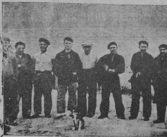
La tripulación del "Abel Matutes"