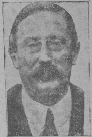
León Blum, cuya agresión ha motivado la disolución de la Liga de Acción Francesa

"Yo cuento en absoluto con la victoria de las derechas, cuyo triunfo permitirá ver nuevos horizontes políticos para España. Los socialistas y