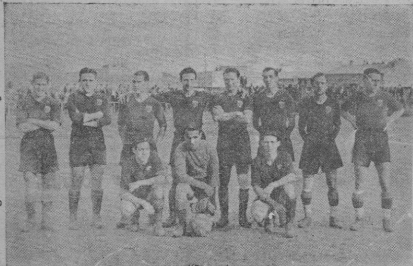
El equipo del C. D. Mallorca que el domingo venció al Ciudadella proclamándose campeón de Baleares de 1935-36

Los del Ciudadella efectúan algunos avances, que son contenidos por la defensiva roja.