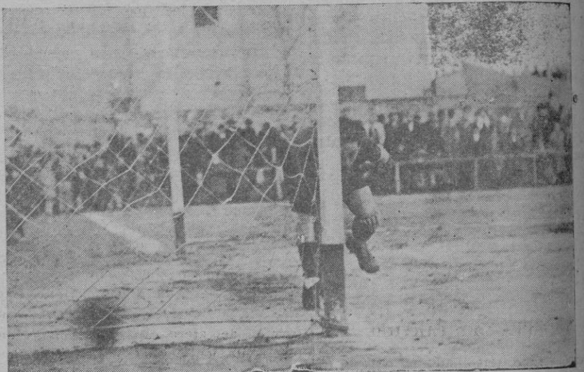
El segundo goal del Mallorca, marcado por Planas al ejecutar un penalty.