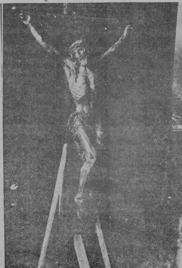
Miguel Blay acaba de fallecer en Madrid. He aquí una de sus más grandes obras. Un magnífico Cristo

Un caso y un ejemplo acaban de darlos los izquierdistas en su manifiesto electoral cuando dicen que hay que reformar la ley de orden público. Pero no fueron ellos los que la hicieron en las Cortes Constituyentes sometiéndonos a todos los espíritus liberales a una verdadera coacción entre el dilema: O se aprueba la ley de orden público o se mantiene intangible la ley de defensa de la República? Yo recuerdo que una tarde me acerqué al Presidente de las Cortes para preguntarle qué asunto de los puestos en el orden del día iba a ser discutido, pues deseaba ausen-