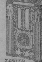
MOD. 730 25 Pts. mes