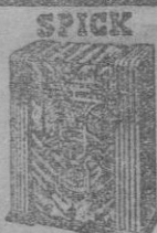
MOD. 130 29 Pts. mes