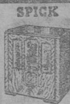
MOD. 531 25 Pts. mes