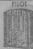
MOD. 55 25 Pts. mes