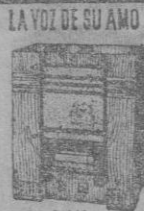
MOD. R. 441 25 Pts. mes