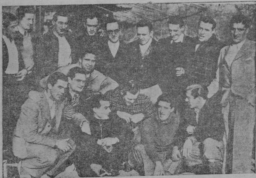
La selección española que hoy se enfrentará con la de Austria.

Con el resultado del partido de ayer el Soledad se proclamó campeón de segunda categoría, grupo Palma.