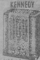
MOD. 64 25 Pts. mes