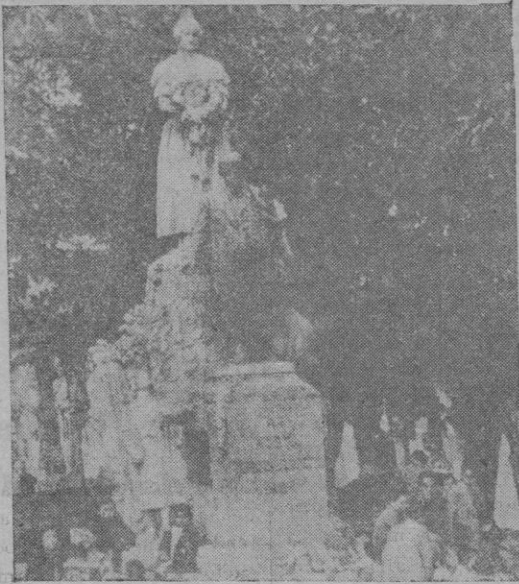
Con motivo del centenario del nacimiento del eximio poeta Teodoro Llorente, se ha celebrado en Valencia un homenaje a su memoria, ante el monumento erigido a Llorente en la Gran Vía.

Después de unas brillantes disquisiciones sobre herencia y terreno, se refirió, como ejemplo de un sistema mandado a desaparecer, al caso de Hans Cartorp, el protagonista de la célebre obra de Tomás Mann. A Hans Cartorp, para curarle su insignificante le-