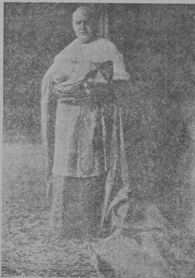
Su eminencia el cardenal Sr. Gomá y Tomás

Será esta alianza la más considerable de las fuerzas de derecha. Por ahora parece que los monárquicos encontrarán serias dificultades para ser admitidos en la unión, pues elementos como don Miguel Manra y algunos radicales se niegan a figurar en candidaturas en las que estén incluidos alfonsinos o tra-