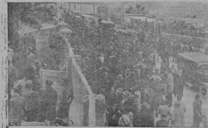
El público formando cola frente las taquillas del Mallorca

"Ventet", "Oca", "Roger", "Sartet", "Kabusheta", "Flor de Neu", "Popéye", "Chafin" y "Gómbit".