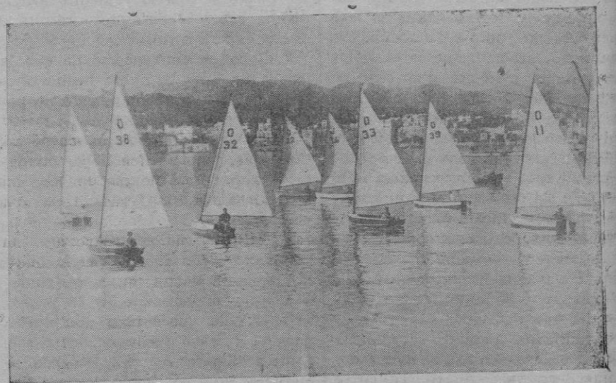
Los monotipos preparándose para las regatas