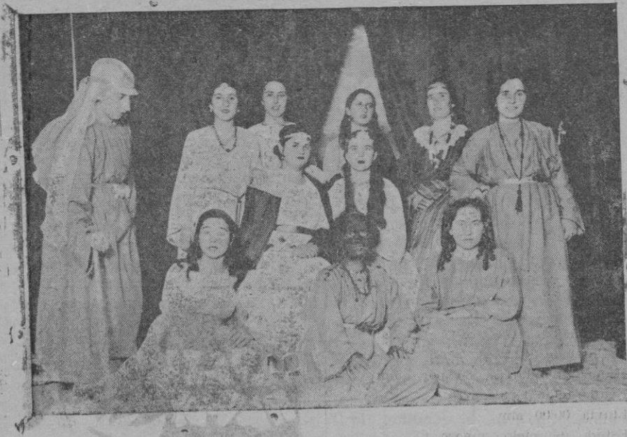
"La Esclava de Fabiola", drama bíblico representado por las señoritas alumnas del Colegio de Ntra. Sra. de la Providencia