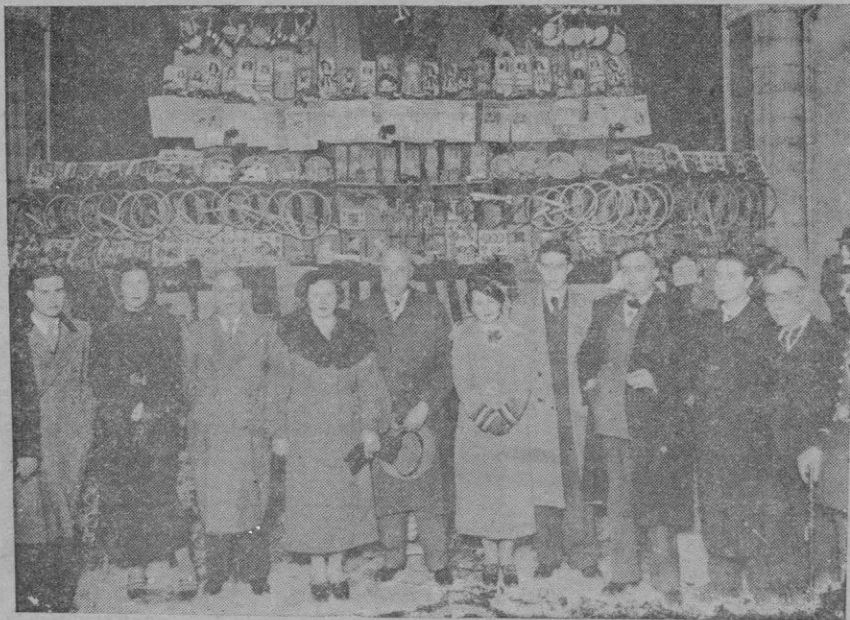
Las autoridades en la inauguración en el Ayuntamiento de la exposición de juguetes para la cabaigata de la víspera de Reyes

Ante las dificultades que surgen para las coaliciones electorales, creemos que, aun estaríamos a tiempo de lograrlo, con la representación proporcional habrían desaparecido aquéllas; cada partido iría solo a la lucha, ya que coaligado nada ganaría, y así no daríase lugar a confusiones y a amalgamas que pueden repugnar a elementos de los partidos que forman la coalición.