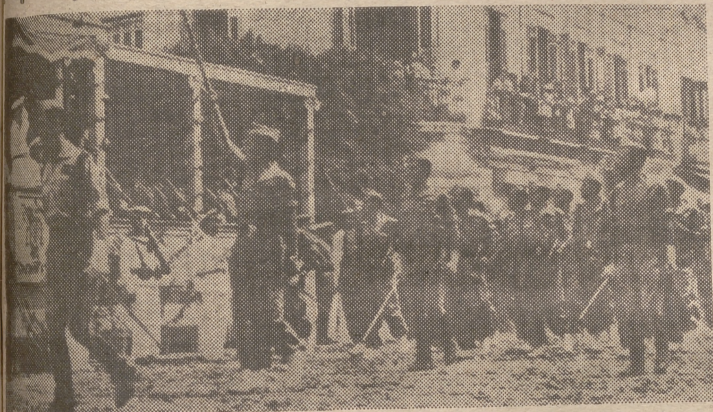
Melilla. — Fuerzas de la Legión desfilan ante el teniente general Galera Paniagua, jefe de las fuerzas españolas en el norte de Africa, con motivo de su primera visita oficial a esta plaza.