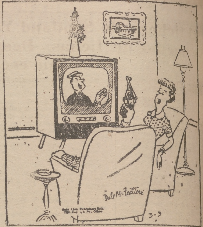
—¡Hombre, dale una oportunidad, a lo mejor es bueno!