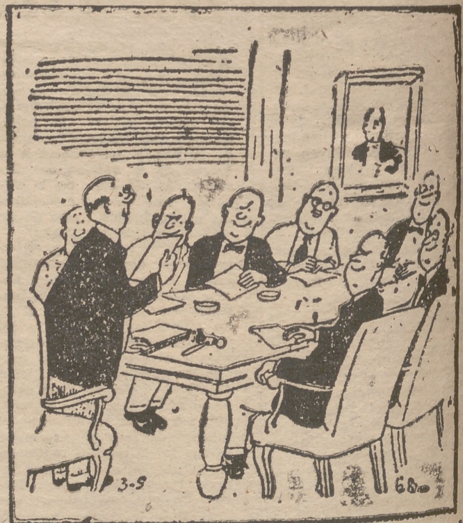
—Primero, como de costumbre, expondremos las sugerencias de nuestras esposas.

SIN HUMO SIN POLVO SIN MAL OLOR GUISAR CON GAS ES LO MEJOR