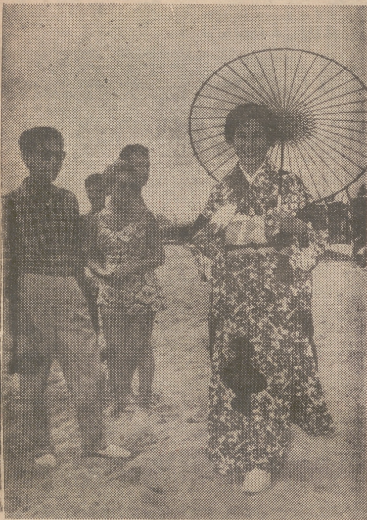
Venecia.—La linda estrella de cine, japonesa, Aiko Mimasu, se fotografió de esta manera cuando fue a pasear a la playa del Lido veneciano. Alko llegó a esta capital para asistir al festival cinematográfico de Venecia.