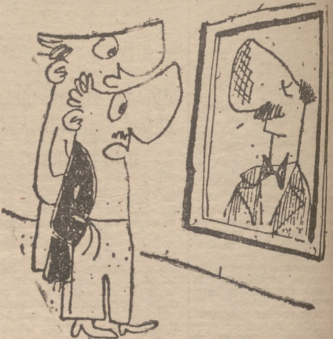
—Este retrato tiene un defecto. —¿Pero si está hablando! —Por eso; el modelo era tartamudo.