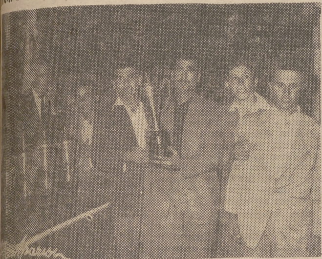
Los vencedores del concurso reciben el correspondiente trofeo

El equipo de Ampolla (Tarragona), proclamado campeón nacional por su dominio de rapidez a los segadores de Sueca