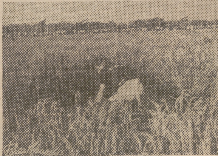
Un momento del concurso de siega de arroz

El equipo de Sueca fué premiado asimismo con mil pesetas y premio extraordinario de rapidez.