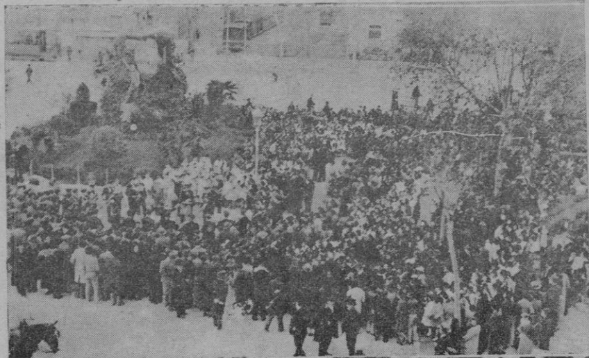
Los niños de las Escuelas Públicas en el homenaje ante la estatua ecuestre del Rey D. Jaime