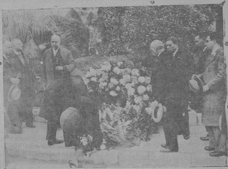
Momento de depositar los gestos municipales, el ramo en el monumento al Conquistador