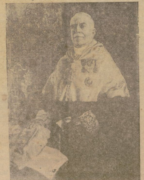
Retrato de D. Gabriel Llabrés, obra de D. Pedro Barceló