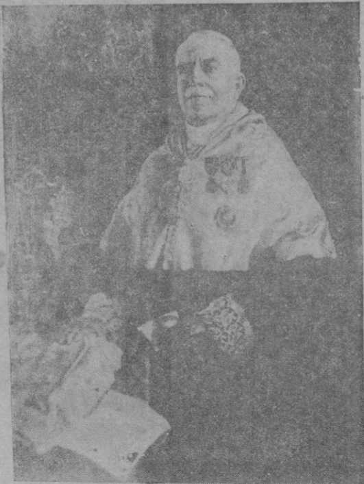
Retrato de D. Gabriel Llabrés, obra de D. Pedro Barceló