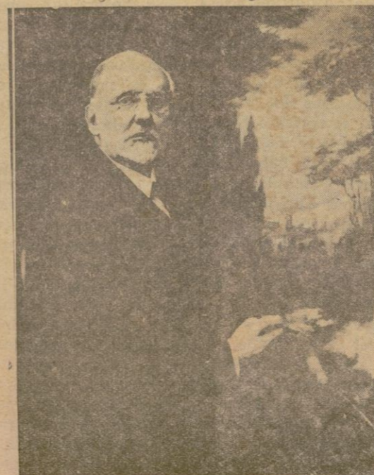
Retrato de D. Fausto Morell, obra de D. Vicente Furió