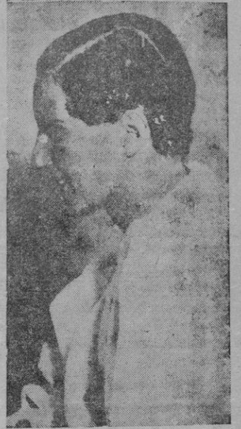
Señorita inglesa que se destacó en el concurso de peinados celebrado en el Horticultural Hall, de Londres

Y pureza en las urnas, para lo cual el carnet electoral es el gran esterilizador de las maniobras deshonestas.