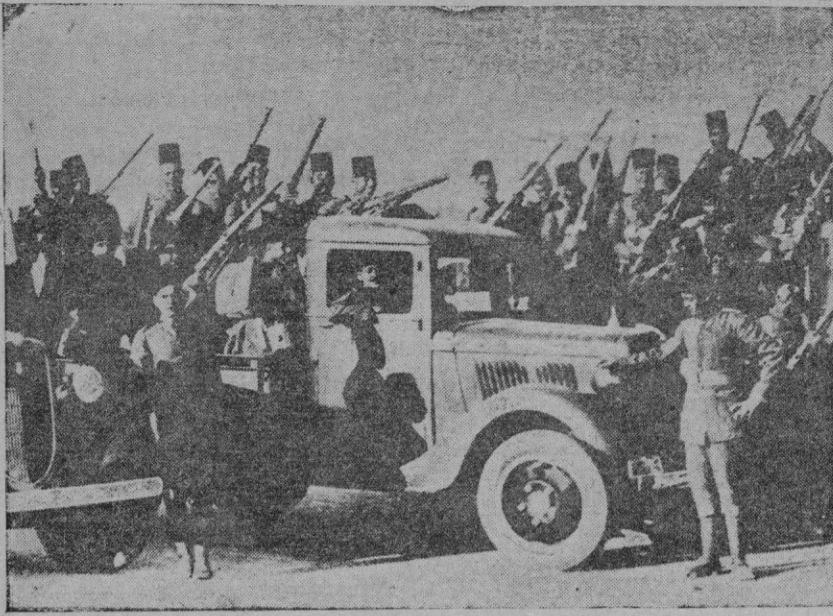
De la agitación nacionalista en Egipto. — Policía egipcia, en camiones