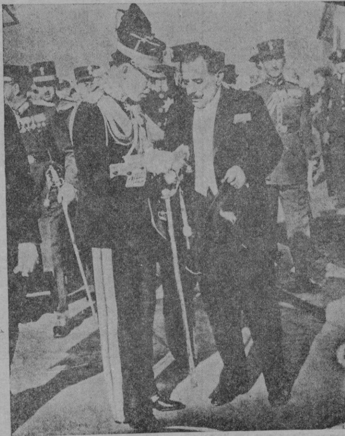
El rey de Grecia conversa con el general Condylis a su llegada a Atenas