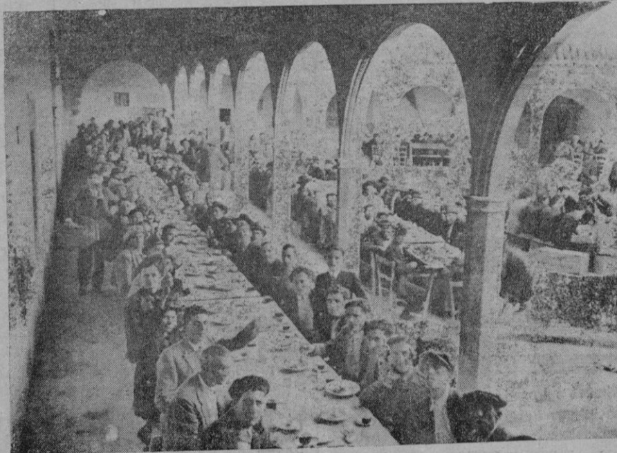
Aspecto que ofrecía durante la comida en Montesión de Porreras los 700 socios de El Porvenir al conmemorar su 25 aniversario