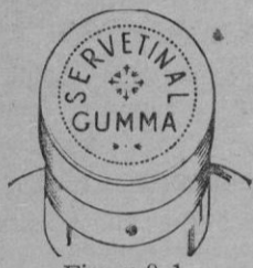
Fig. n.º 1

Esta cápsula es plateada por los lados y granate en su parte superior, con una inscripción en relieve formada por el mismo metal de la cápsula que dice "SERVETINAL GUMMA"; la palabra SERVETINAL de forma circular y la palabra GUMMA recta, debajo de la que dice SERVETINAL . Véase figura n.º 1.