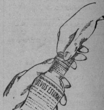
Fig. n.º 4

Por consiguiente, todo frasco que no lleve las cápsulas cuyas características y grabados insertamos, para mayor conocimiento del público, debe ser rechazado, pues en este caso se trataría de una FALSIFICACION. Así mismo rechace el SERVETINAL vendido a granel, pues también es FALSO.