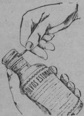
Fig. n.º 3