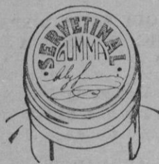
Fig. n.º 2

Esta cápsula es totalmente plateada o sea del mismo color natural del estaño; en su parte plana superior o cabeza, ostenta una inscripción en relieve formada con tinta de color encarnado que dice "SERVETINAL GUMMA" y debajo de esta inscripción la firma del autor. Véase figura n.º 2.