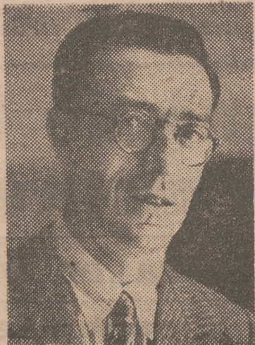
VICTOR RUIZ IRIARTE