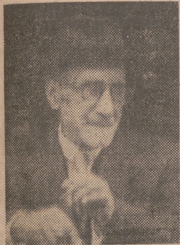
DON JACINTO BENAVENTE

Don Jacinto Benavente, a sus ochenta y siete años de edad, sigue escribiendo con la ilusión de sus mejores tiempos. Don Jacinto está veraneando en Galapagar y lleva en manos, nada menos, tres comedias. He aquí sus títulos y el nombre de las compañías a que van destinadas: "Caperucita asusta al lobo", para la formación de Isabella García y Arturo Serrano; otra obra con destino a la compañía de María Guerrero y Pepe Romeu y una nueva comedia sin título, aunque sí con destino. Pero el hombre se calla el nombre.