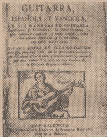
Portada de la "Guitarra española"