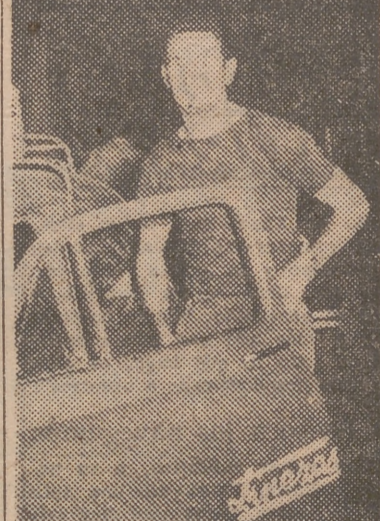
El futbolista holandés, fotografiado junto a su coche, un "Fiat" color gris, con el que hizo el viaje a nuestra ciudad