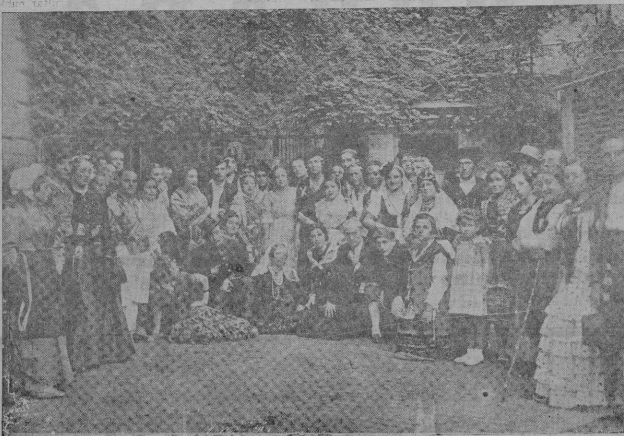
Roma. — Parejas ataviadas con los trajes representativos de todas las regiones españolas, que fueron a Roma con motivo de la boda de D. Juan de Borbón. — Junto a D.ª MaMria Cristina (señalada con una cruz) se vé a la pareja de Mallorca

Preferible leche de 4 a 12 meses. Informes: calle Lorenzo Vicens, número, 3, 4.º piso. — Travesía Anselmó Clavé y Alejandro Rosselló.