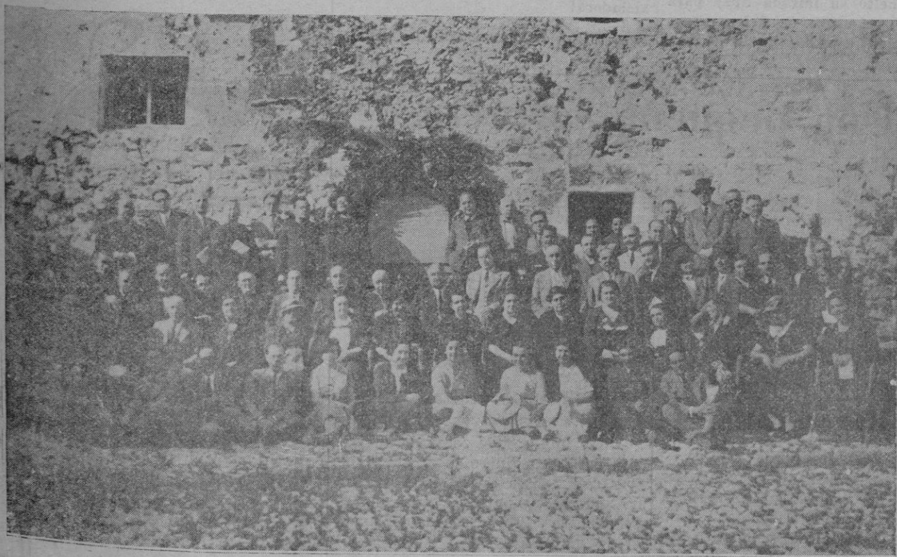
Grupo de los asistentes al Homenaje a Costa y Llobera en Formentor